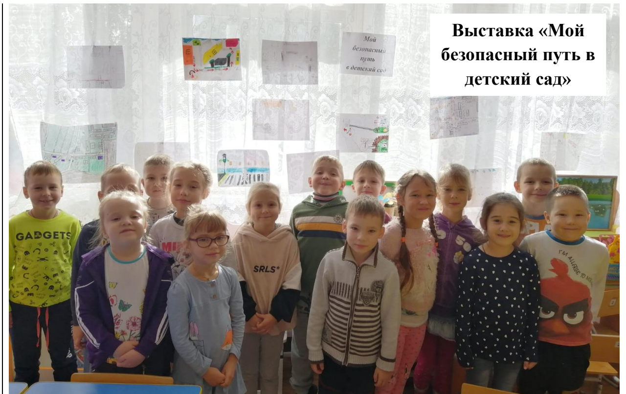
Выставка «Мой безопасный путь в детский сад»