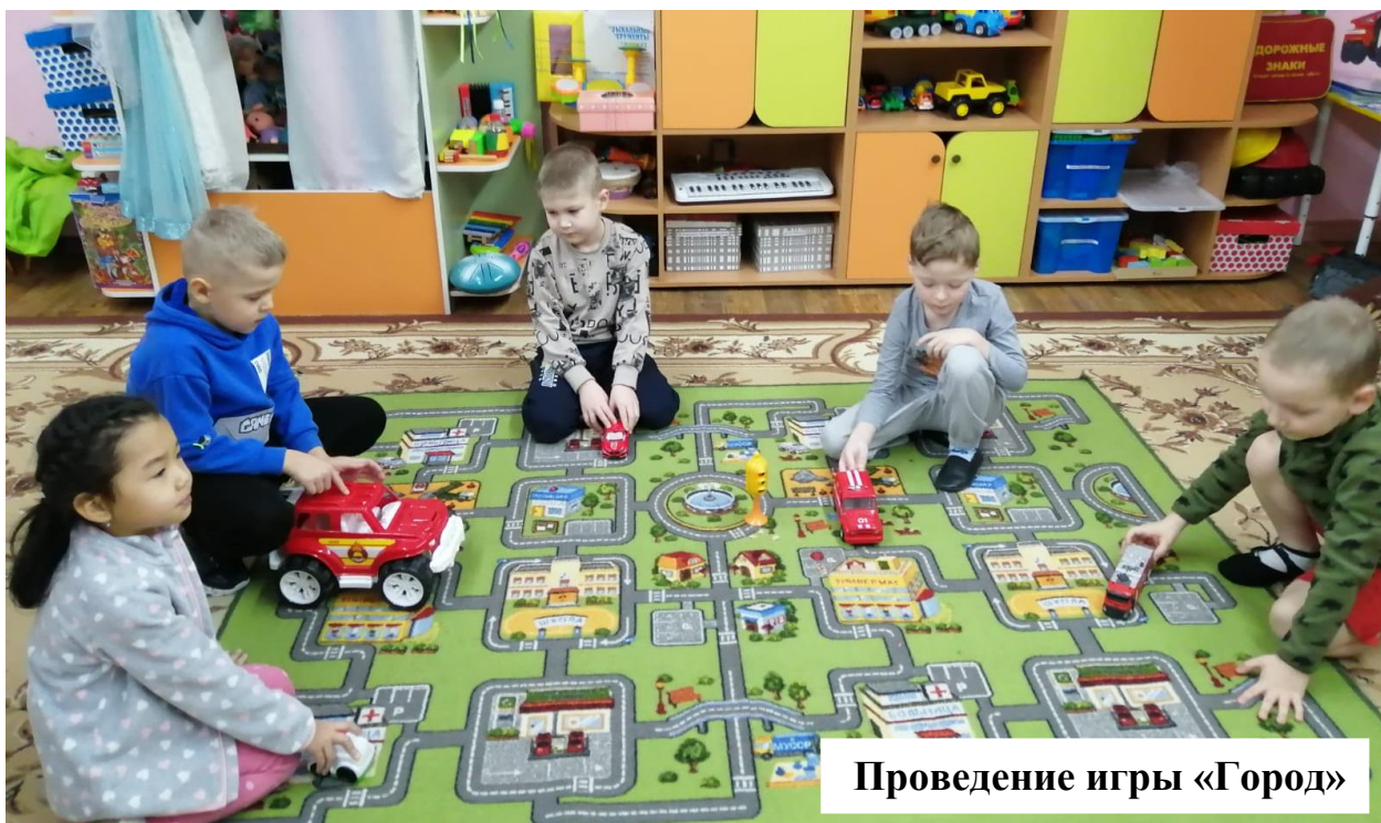
Проведение игры «Город»

организация и проведение игры «Город» на дидактическом коврике; раздать детям игрушки-машины: грузовая, легковая, пожарная, полиция, скорая; машины свободно передвигаются по дорогам, услышав сирену пропускают выехавшую машину экстренной службы