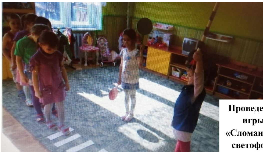
Проведение игры «Сломанный светофор»

игра «сломанный светофор»: из детей выбирается «регулировщик», который будет регулировать движение, выдается жезл и соответствующие элементы одежды; дети «пешеходы» внимательно наблюдают за командами «регулировщика» и выполняют их